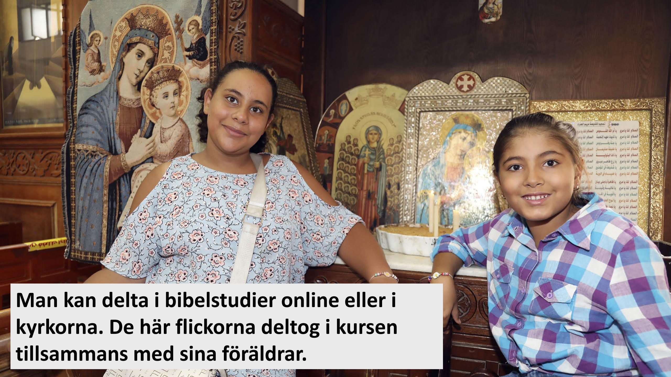
Man kan delta i bibelstudier online eller i kyrkorna. De här flickorna deltog i kursen tillsammans med sina föräldrar.