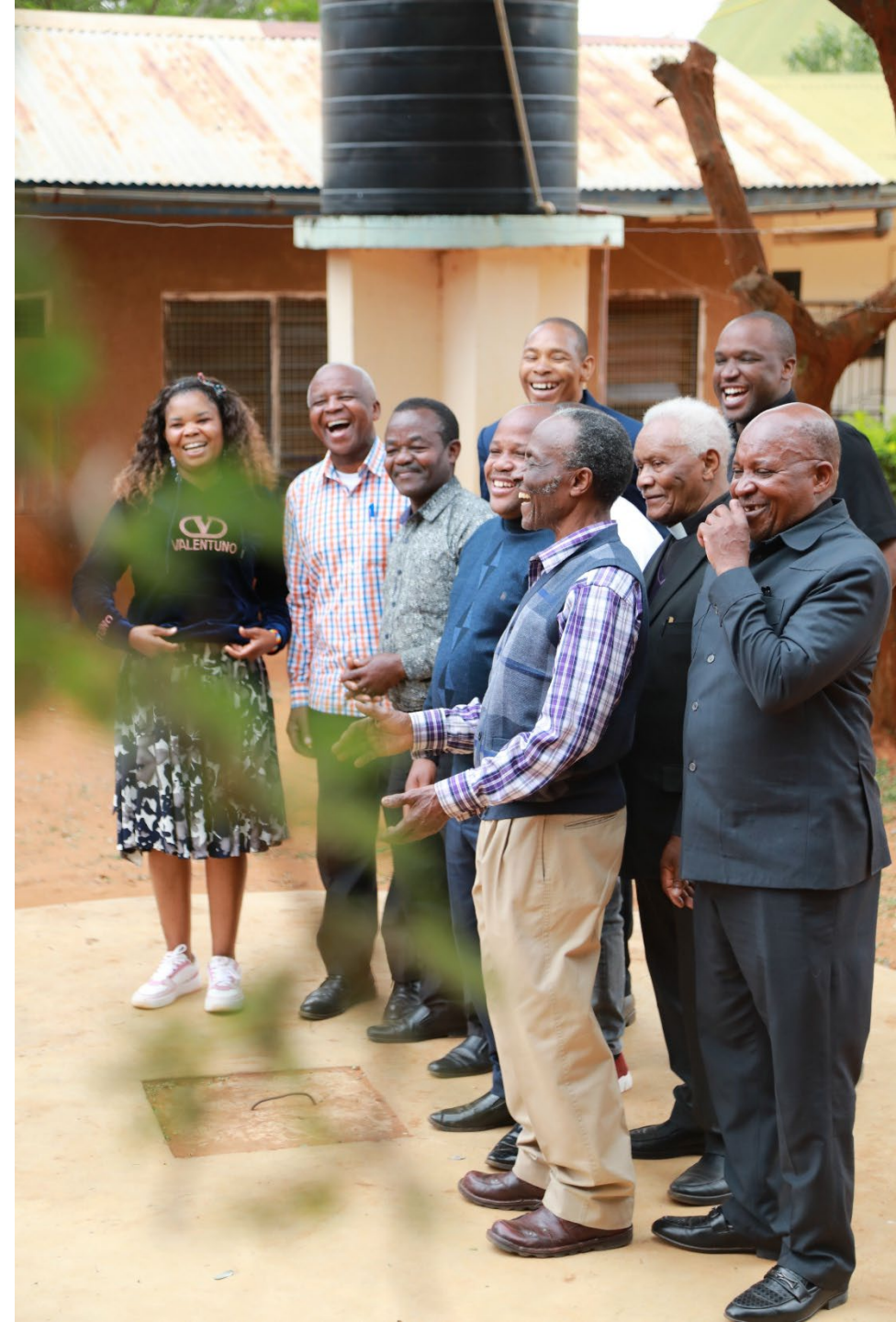
Kuvassa käännöstiimi ja paikallisen arviointiryhmän jäseniä (2025)